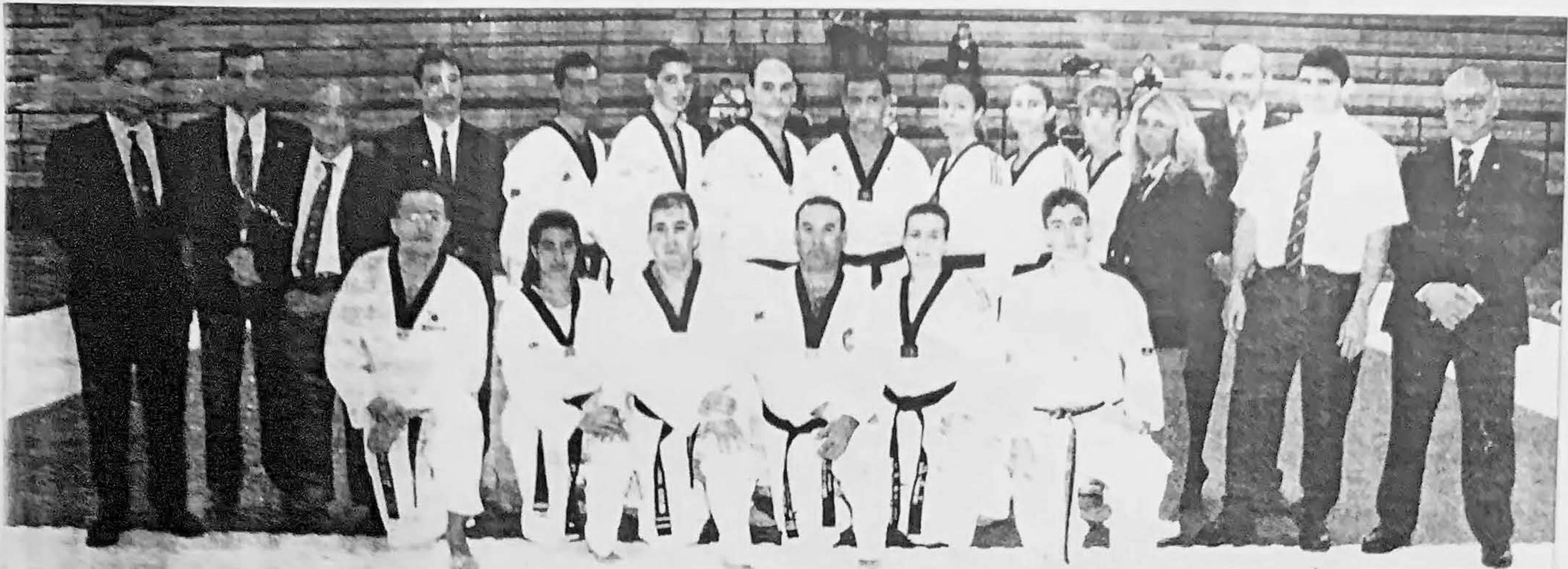
En la imagen, los competidores, jueces y técnicos que participaron el Regional de Técnicas y Pumses, celebrado en el pabellón Antonio Moreno de Las Remudas